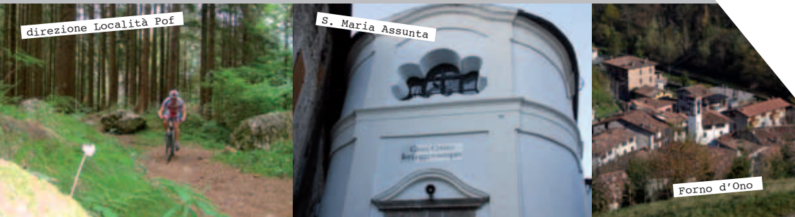
direzione Località Pof

Costruita una prima volta nel 1338, fu riedificata verso la metà del '600 e consacrata nel 1652. L'affresco raffigurante la Madonna in trono con il Bambino con tre figure di Santi a grandezza naturale è considerato il più antico affresco della Valle Sabbia (primi decenni della seconda metà del '300). La facciata della chiesa attuale è di un barocco elegante. All'interno, l'altare maggiore è impreziosito dal ciborio opera dei Boscai e dalla pala, datata 1652, raffigurante l'Assunta.